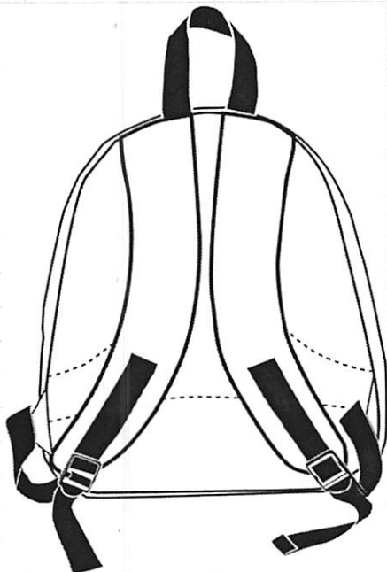
B. VISTA TRASERA