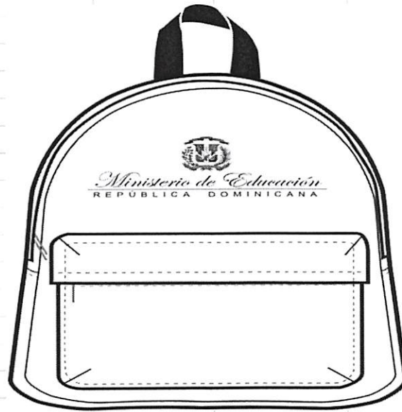
A. VISTA FRONTAL