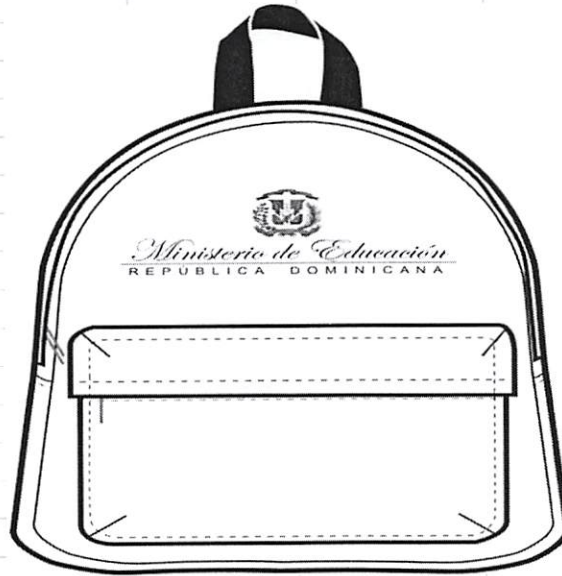
A. VISTA FRONTAL