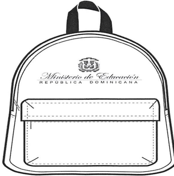
A. VISTA FRONTAL