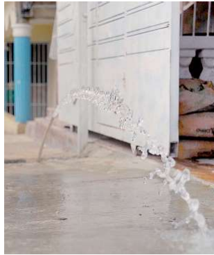
Tubería con agua potable. F.E.