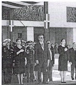
Presidente Luis Abinader, F.E.

DISPOSICIÓN. El presidente Luis Abinader emitió ayer el decreto 101-22, que pone en retiro a un mayor general de la Fuerza Aérea y seis generales de brigada del Ejército Nacional.