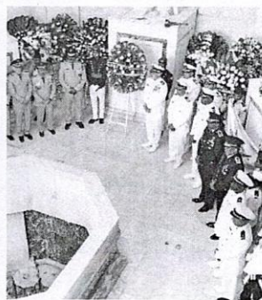
Uno de los actos realizados ayer por oficiales de las Fuerzas Armadas, F.E.

Los actos solemnes iniciaron con los honores de estilo al Presidente de la República en el frontispicio del Congreso Nacional. Posteriormente se depositaron ofrendas florales en la Puerta de