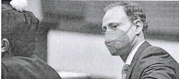
El exprocurador Jean Alain Rodríguez cumple prisión preventiva en Najayo.