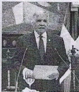
Eduardo Estrella, presidente del Senado.

También quedó pendiente la selección del Defensor del Pueblo y sus suplentes,