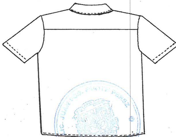
Figura no. 2