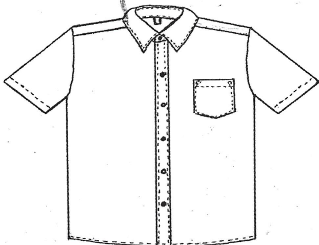
Figura No. 1

La camisa escolar se entrega por números, con las dimensiones establecidas en la tabla No. 1. En las figuras No. 1 y No.2 se pueden observar la ubicación de las medidas en la camisa.