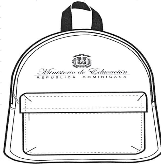
A. VISTA FRONTAL