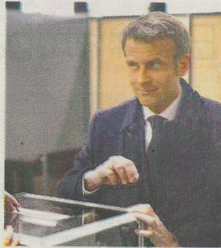
Emmanuel Macron mientras ejerce su derecho al sufragio.

El anuncio de los resultados coincidió con llamamientos de la mayoría