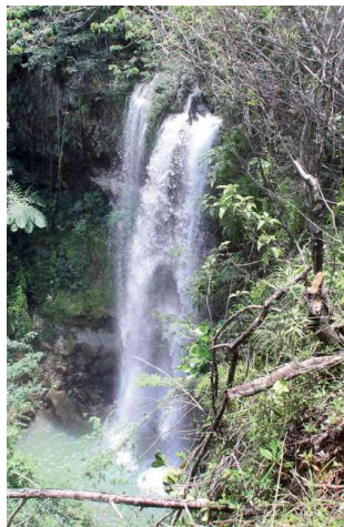
Los saltos son de fácil acceso. M.V.

Es de mayor espesura o grueso de agua, que al caer a la charca emite un sonido que simboliza el trinar de la avecilla que honra su nombre. Aquí el astro sol preña la charca de rayos, al estar en un cañón de rocas que lo protege. ●