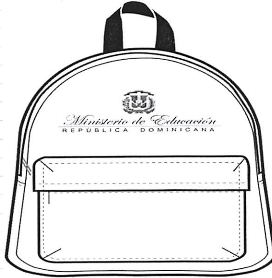
A. VISTA FRONTAL