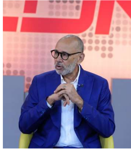
PROGRAMA TELEVISIVO DESPIERTA CDN