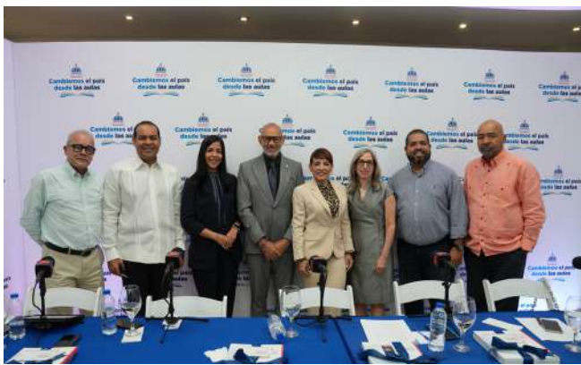
PROGRAMA RADIAL EL SOL DE LA MAÑANA