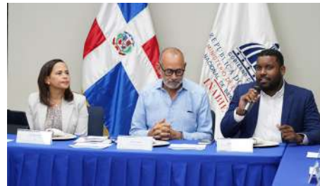
ENCUENTRO CON PERIODISTAS de la fuente Economía de los principales medios de comunicación