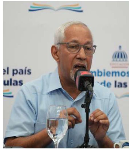
PROGRAMA RADIAL EL GOBIERNO DE LA MAÑANA, Z-101